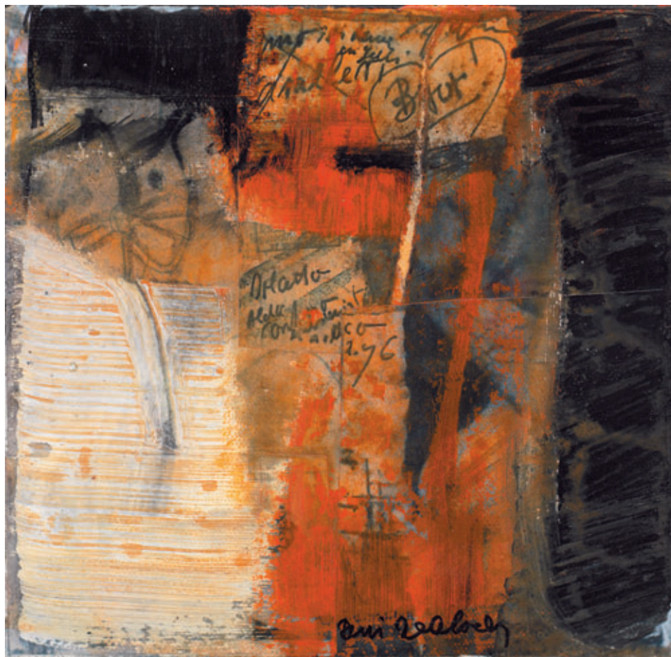
«Eingebettet» 20 x 20 cm