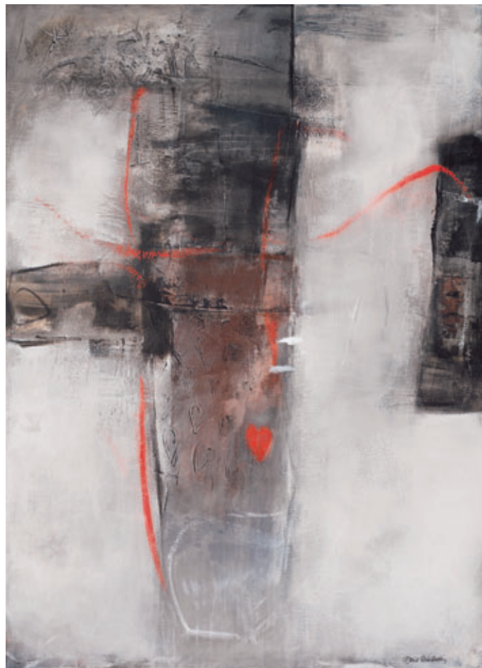
«Love letters» 140 x 100 cm