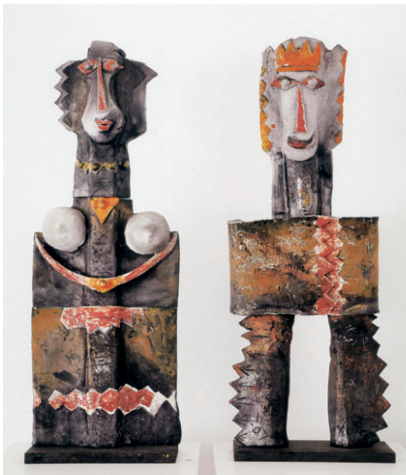
«La copia» Raku Höhe: 84 cm Breite: 30 cm