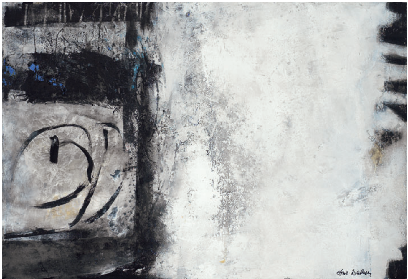
«Black and white»