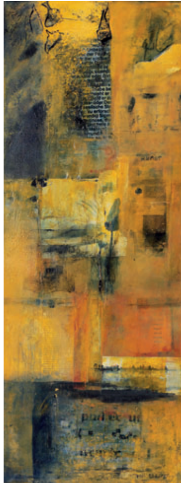
«Spielereien I u. II» 45 x 120 cm