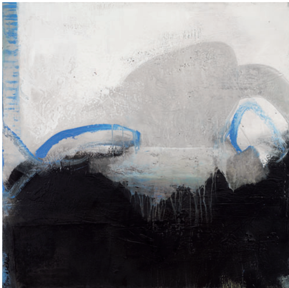
«Wenn die Nebel steigen» 100 x 100 cm